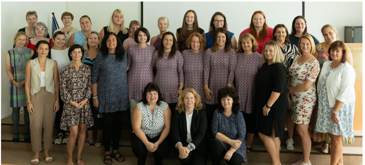
... pokračování ze strany 2